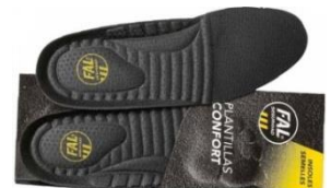
Plantillas extraíbles. Lavables