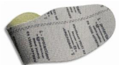
Plantilla anti-perforación flexible