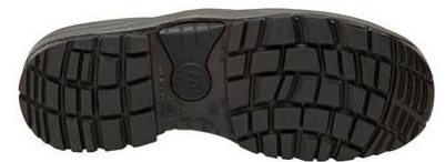
Suela Antiestática + Resistente a los hidrocarburos