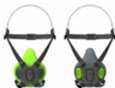
Respiradores semi faciales BLS 4000 S - BLS 4000R