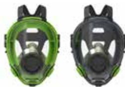
Respiradores de cara completa BLS 5700 - BLS 5600