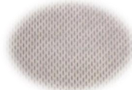
Forro resistente a la abrasión