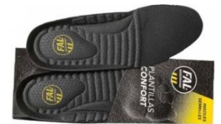
Plantillas extraíbles. Lavable