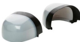
Puntera no metálica