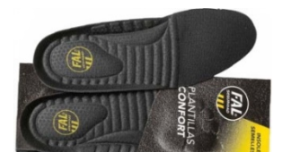
Plantillas extraíbles. Lavables