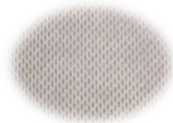
Forro resistente a la abrasión