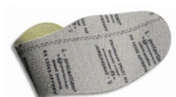
Plantilla de protección flexible